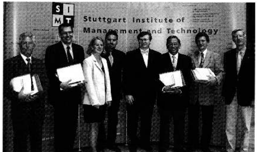
Lizenzvergabe an Hochschulinstitute.

IBK stellt allen Interessenten auf seiner Website ( www.ibk-group.com ) eine Testversion bereit, die nach Installation für 30 Tage das Arbeiten mit allen zurzeit verfügbaren Wissensbasen erlaubt. Die Module lassen sich später problemlos zu einer Vollversion freischalten, sodass alle bis dahin gesammelten Daten produktiv weitergenutzt werden können.